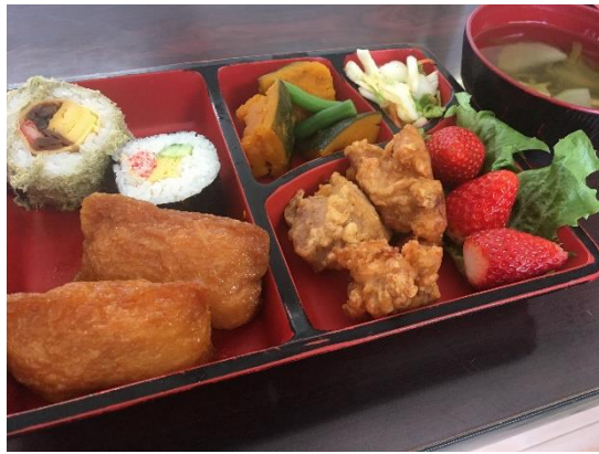
見た目もお腹も満足♡

二月三日は節分!というところで、この日のお弁当は超豪華なスパシャル弁当!きゅうり、かにかま、卵焼きが入った太巻き、とろろ昆布に巻かれた太巻き、いなり寿司が二つ、そしてからあげ、つみれ汁、デザートにはいちごも付いてポリュームも満点!