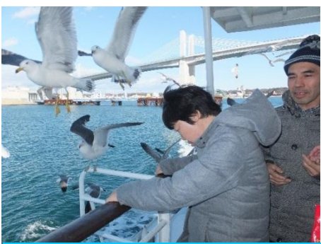
数えきれない程のカモメが船に集まっています！

一年の締め括り、そして新年始めにふさわしい、内容盛りだくさんの充実した旅行に、皆さんも笑顔いっぱいでした。(秋山)