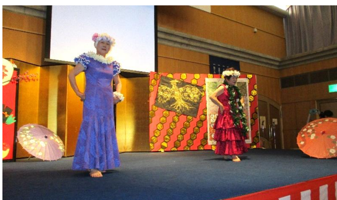
ハワイアンの雰囲気たよう 華やかなショーでした★