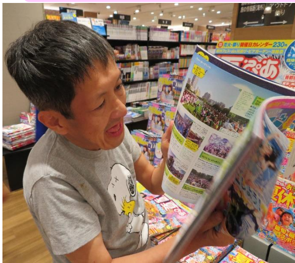
次はどこに行こうかな？