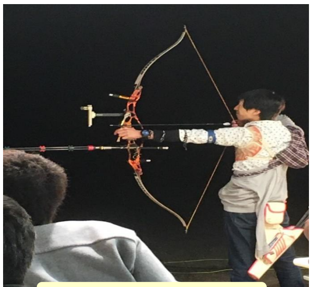
ターゲットは外しません!

まだまだ戦力になれるほどの力はありませんが、もっともっとストイックに物事に取り組んでいき、早く一人前になりたいと思っています。これからよろしくお願ひいたします。