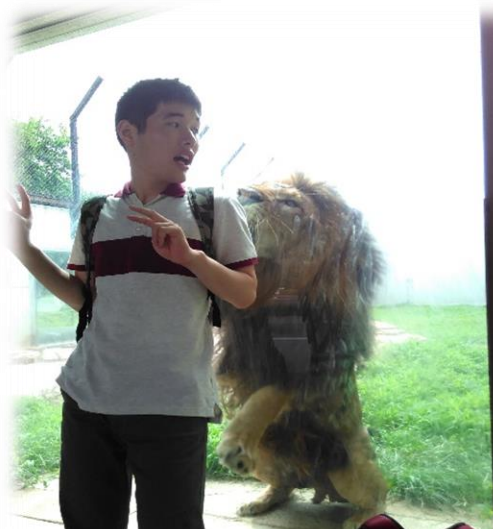
大きなライオンに圧倒されました

6月26日は千葉市動物公園にでかけました。小雨が降りどうなるか心配していましたが、何とかいいお天気に。動物園ならではの生き物と触れ合い、楽しんで頂けました。