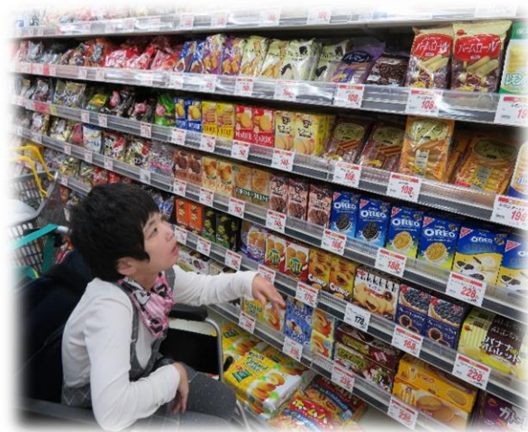
どれにしようかな

6月21日はひだまり科6人で佐原のアピタにショッピングに出かけました。本来は屋外のスポットに出掛けるはずが、梅雨には勝てず・・・。 ですが、自分の好きなおやつや日用品を買って皆さん大満足です。