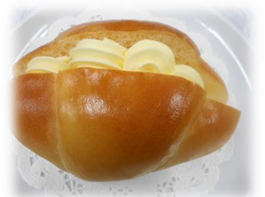
人気第1位 レモンホイップパン

そして、第1位に輝いたのがレモンホイップパンです。(130円)みなさんはホイップと聞くとあの甘いホイップを想像するのではないのでしょうか?このレモンホイップは瀬戸内産のレモン果汁をふんだんに使用しているので甘さもくどなく食べた際にレモンの風味を感じられるホイップクリームなのでこの季節にピッタリです。また、女性にも人気商品です。おすすめの食べ方は少し冷やしてから食べた方がより一層おいしく召し上がれます。以上、空飛ぶパンだから新作パン紹介コーナーでした。みなさんのご購入を心待ちにしています。(土屋)