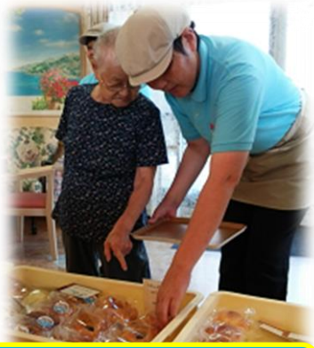
接客も慣れてきました

活動開始から4か月が経ち、それぞれの場所や活動にも慣れ、皆さまにおいしいパンと笑顔をお届けできているかと思えます。その甲斐あってか、パンの売り上げもうなぎ上りの好調で、私たちにとっても販売の楽しさや意欲の向上を日々感じる事ができています。販売時間に各場所それぞれ違いはあ