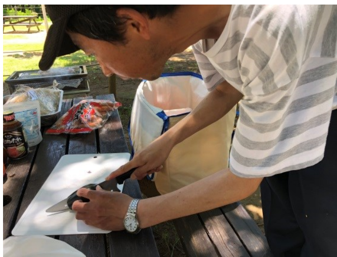
草刈さながらの包丁さばき

買い出しを終えて到着したのは北総花の丘公園のバーベキュー場。最近できた公園で尚且つ平日ということもあってか、ほぼ貸し切り状態でした。さあ、楽しい楽しいバーベキューのスタートです。