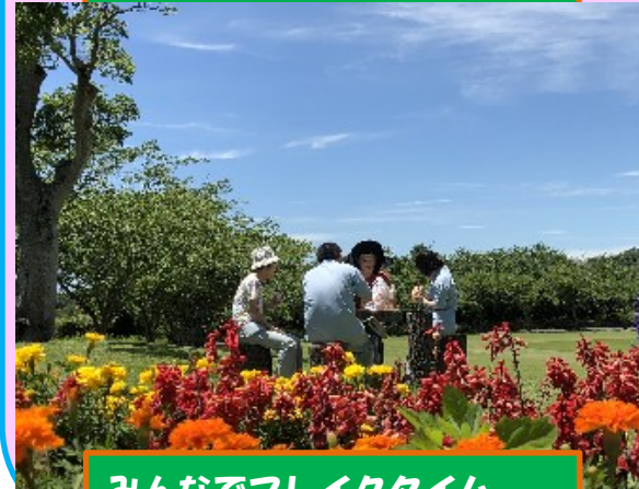
みんなでフレイクタイム