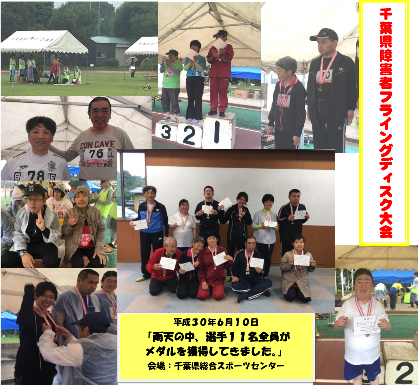
平成30年6月10日 「雨天の中、選手11名全員がメダルを獲得してきました。」 会場：千葉県総合スポーツセンター