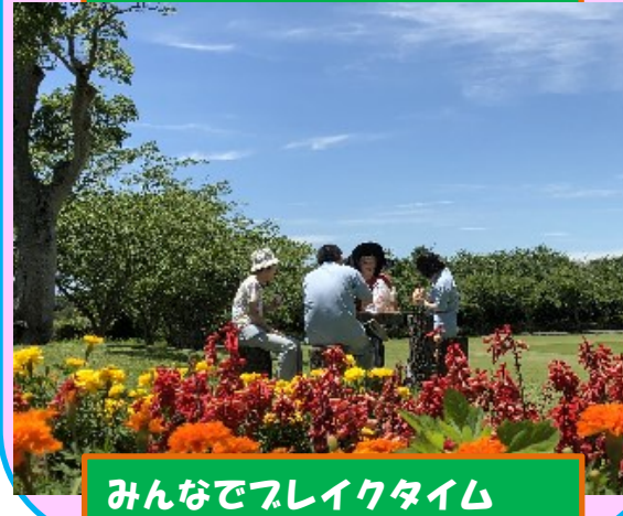
みんなでフレイクタイム