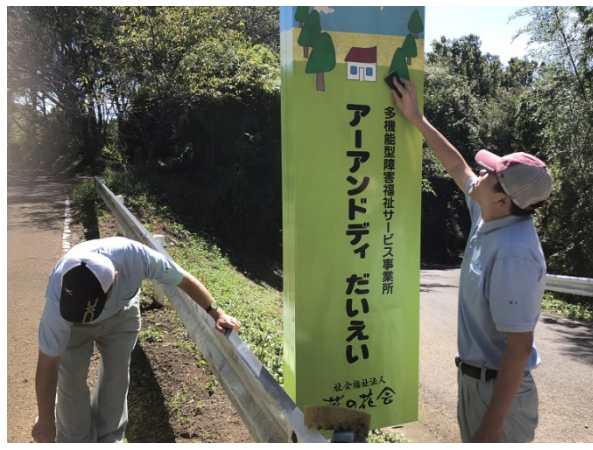
お祭りに向けて、看板綺麗になりました

今年もアーアンドデイだいえい祭りに向けて、利用者さんと一緒に施設周辺の環境整備を行いました。利用者さんもお祭りが楽しみなよう時々「お祭り楽しみだね」と職員と話しながら屋外の看板磨きやガードレール磨きなどを頑張ってくれまし