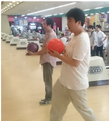
楽しみにしていた外出

聞いて、みなさんすぐに気分が高揚してワクワクしている様子でした。チームに分かれてボウリングシューズに履き替え、ボールを選び、いざゲームスタート。きれいなフォームの方もいれば、ゆっくり転がす方もおり、皆さん思い思いにボールを投げ、ストライクが出たシーンでは大きな歓声が上がリ、皆でハイタッチ! 皆さん思い思いにボウリングを楽しまれていました。