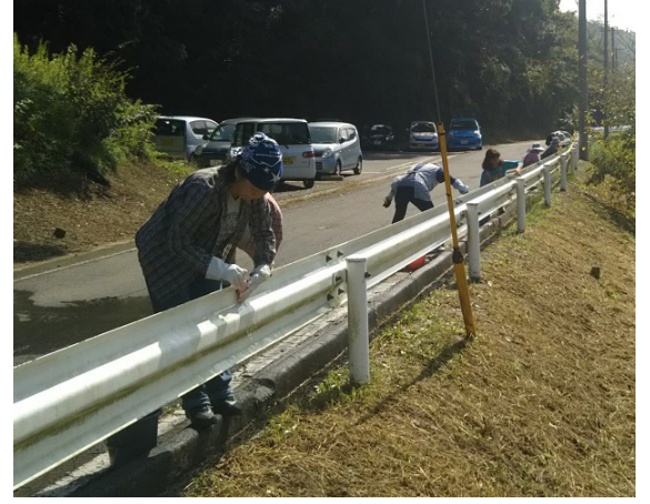
親御さんのご協力、ありがとうございます

た。ガードレール磨きと言えば、10月6日に親御さんによる環境整備も行って頂きました。ガードレール磨きを始め、テントの骨組み準備、施設周辺の草刈、施設外壁洗浄、室内のワックス掛けなど環境整備を