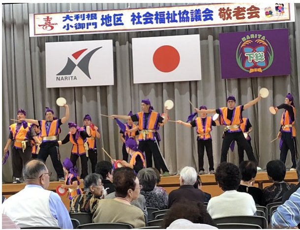
音楽に合わせての演舞

出演が決まったときには「今年も出れるんですかー!」「がんばりますー!」など、皆さん嬉しそうに本番に向けて意気込んでいました。当日はあたたかい手拍子に合わ