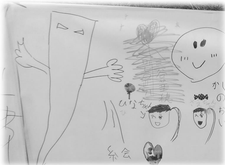
【大勢の画伯による大作】

ゲームコーナーでは、お祭りに来てくれた子供たちが、輪投げや玉入れなど、夢中になって遊んでいました。一通り遊び終わったあとは、らくがきコーナーで子供たちの個性あふれる絵や文字を描いてくださいました。みなさんが描いたものは、とても可愛らしく、今回の祭りの大切な思い出となりました。描いてくださったみなさん、ありがとうございました。