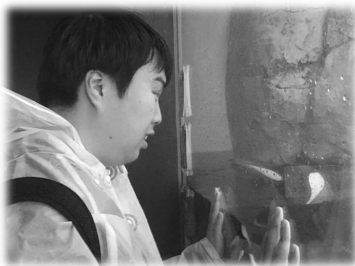
ペンギンとご対面

色々な魚がいて、素人目では何が何の魚か分からず、何度説明書きとにらめっこしたかわかりません。こちらの写真は、利用者さんが水槽に近づくと、ペンギンからこちらにきてくれた時の写真です。これには、「おー」と声を出して喜ばれていました。