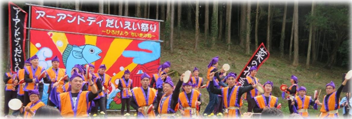
【力を合わせて踊ったエイサー】

オープニングを堂々と飾ったのは利用者さん達によるエイサー。この日の為に練習を重ねてきました。消極的だった利用者さんも練習を続ける中でどんどん積極的になり、本番直前の練習では田陣を組み、大きな声で「頑張るぞ」と気合十分。一緒に練習してきた職員はその姿に感動してしまいました。いざ本番。今まで頑張ってきた成果を皆さんに披露できました。一生懸命汗をかきながら皆が一体となった立派なステージになったと思います。